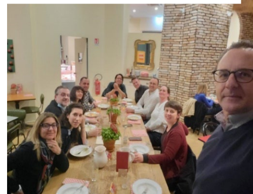
Projekt-Treffen in Mailand